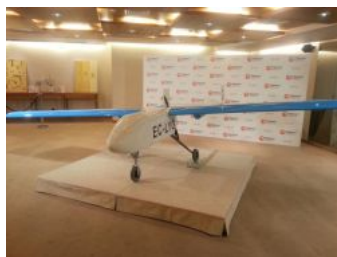
Primer 'drone' para uso civil matriculado en Europa

Temas relacionados: Aviación deportiva Tecnología Deportes aéreos Empresas España Economía Telecomunicaciones Deportes Ciencia Comunicaciones